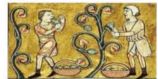
VASALLO O SIRVO

Viven en monasterios, Oran, estudian, escriben Libros; poseedores de Tierras y cobradores de Sus propios impuestos, Diezmos y donaciones